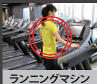
ランニングマシン