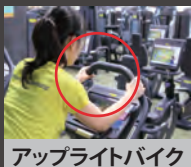
アップライトバイク