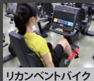
リカレントバイク