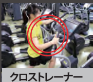
クロストレーナー