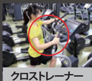
クロストレーナー