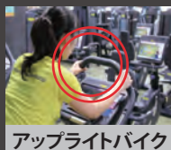
アップライトバイク