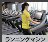
ランニングマシン