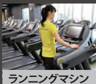
ランニングマシン